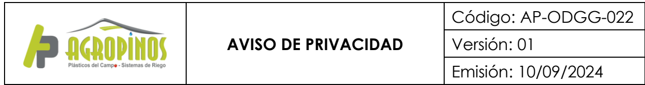
TABLA DE CONTROL DE MODIFICACIONES